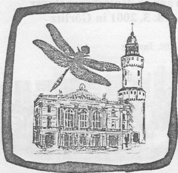
Abb. 2: Logo der 20. Tagung deutschsprachiger Odonatologen in Görlitz

Diese schlesische Stadt hatte ich bisher nur "en passant" und flüchtig kennen gelernt. Neben schönen Bürgerhäusern, einem interessanten Rathaus und der architektonischen Stadtkrone besitzt sie auch ein Naturkundemuseum der Extraklasse.