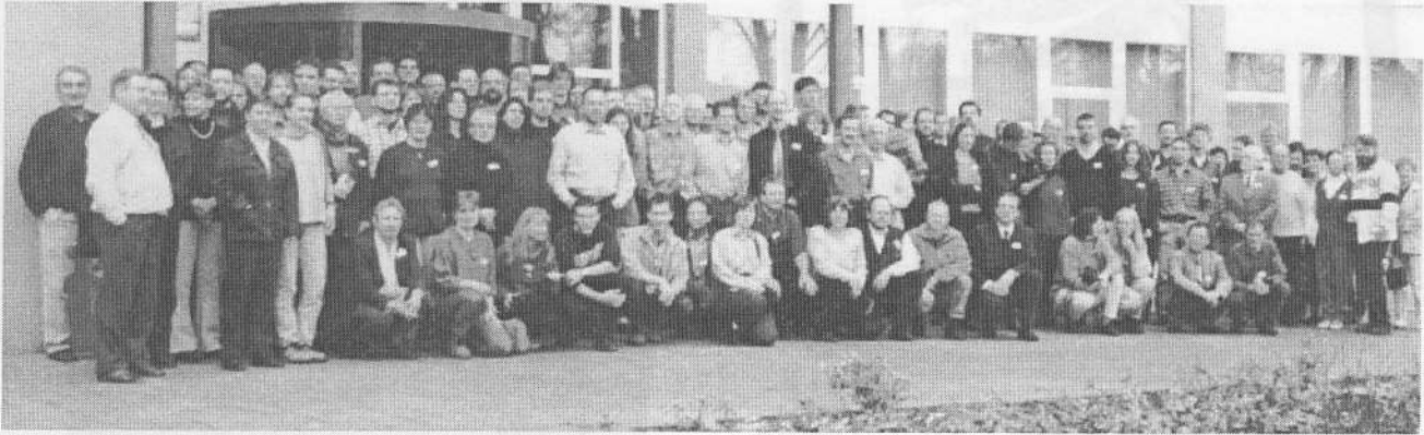
Abb. 1 Die Tagungsteilnehmer auf einen Blick