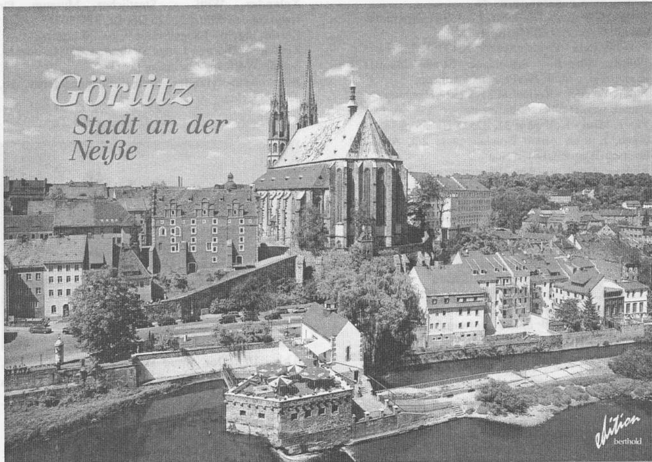
Abb. 12: Das schöne Görlitz

Teilnehmer zusammen, die am XVI. Internationalen Symposium der Odonatologie, das im Juli in Novosibirsk stattfand, teilnahmen. Hier wurden