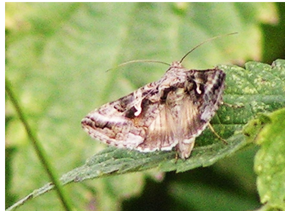
Abb. 5: Die Gamma-Eule ( Autographa gamma L.) saugte an verschiedenen Blütenpflanzen.

Mitte Juli konnten die beiden o. g. Weißlingsarten (Pieridae) regelmäßig auf verschiedenen Ebenen des Daches nachgewiesen werden. Sie saugten v. a. an Gewöhnlichem Thymian ( Thymus pulegioides ) und blühenden Fetthennen. Im typisch schnellen Flug war eine Gamma-Eule ( Autographa gamma L.) zu beobachten, die auf der unteren Ebene des Daches verschiedene blühende Pflanzen anflug (Abb. 5).