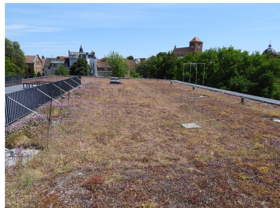
Abb. 3: Mittlere Ebene des begrünten Daches (stadtnahe Seite) u. a. mit blühenden Schnittlauchpflanzen im Mai 2023.