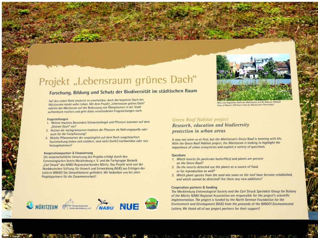
Abb. 9: Neben dem wissenschaftlichen Aspekt hat das Projekt auch einen Bildungsauftrag, so dass auf dem Gründach eine Ausstellung zur Bedeutung von bewachsenen Dächern für die Biodiversität entsteht.