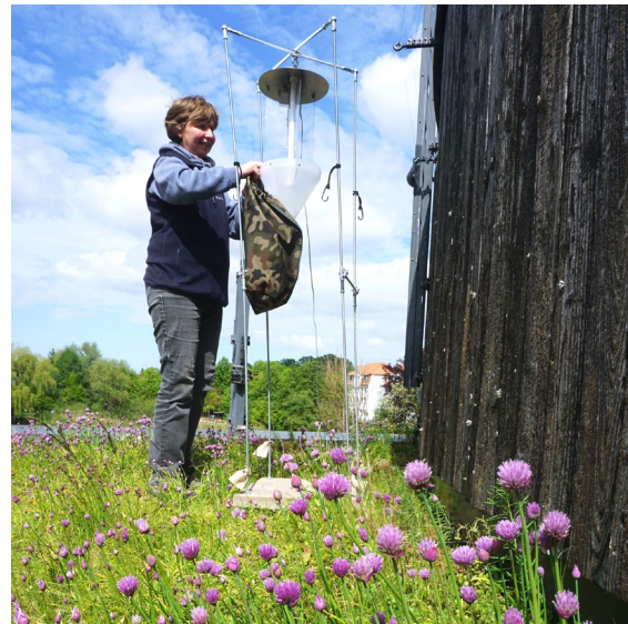
Abb. 4: Eine automatische Lichtfalle wird für den Nachtfang vorbereitet

Zudem wurden optimale Standorte für den Einsatz von automatischen Lichtfallen mit superaktinischen Leuchtstoffröhren nach WEBER (Hängemodell) ermittelt (Abb. 4). Dabei spielten die Kriterien Windanfälligkeit und das Mikroklima eine besondere Rolle. Auf der unteren und mittleren Ebene des Daches sowie am Herrensee (Referenz) wurden vier Lichtfallen aufgestellt und getestet. Im nächsten Jahr werden diese dann routinemäßig genutzt.