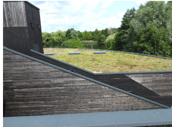
Abb. 2: Ein Teil der unteren Ebene des begrünten Daches mit Blick auf die hölzerne Gebäudefassade im Juni 2023.

Die obere Ebene hat eine Gesamtfläche von ca. 250 m 2 . Das Dach des Fahrstuhlturnes bildet mit einer Fläche von rund 15 m 2 die oberste Ebene und liegt erneut 2 m darüber. Aufgrund der extremen Bedingungen und der Höhe spielen die oberen Ebenen für viele Insekten kaum eine Rolle. Auf sie soll deshalb in der folgenden Betrachtung nicht weiter eingegangen werden.