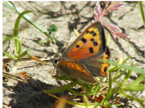
Abb. 8: Der Kleine Feuerfalter ( Lycaena phlaeas L.) sitzt häufig auf Rohbodenflächen und wärmt sich auf.

Ein Weibchen des nach BARTSCHV besonders geschützten Hauhechelbläulings ( Polyommatus icarus Rott.) wurde auf der mittleren Ebene (stadtnaher Teil) beobachtet. Das Tier war bereits stark abgeflogen und setzte sich zum Sonnen immer wieder auf vegetationsarme Stellen. Ebenfalls „besonders geschützt“ ist die zweite Bläulingsart, die dort nachgewiesen werden konnte. Der Kleine Feuerfalter ( Lycaena phlaeas L., Abb. 8) zeigte ein ähnliches Verhalten, was sicherlich auf witterungsbedingte Effekte (teils bewölkt, mäßig windig, Temperaturen bei 26 Grad Celsius) zurückzuführen war.