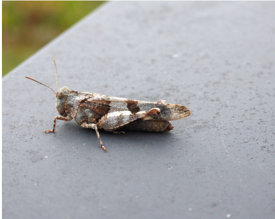
Abb. 6: Die Blauflügelige Ödlandschrecke ( Oedipoda caerulescens L.) hielt sich häufig auf den warmen Abdeckungen der Lüftungsschächte auf.

Die Blauflügelige Ödlandschrecke wird in der Gefährdungskategorie 2 (stark gefährdet) nach Roter Liste Mecklenburg-Vorpommerns (WRANIK et al. 1996) geführt. Auch bei den Hummeln konnten vier Arten auf der in Richtung Herrensee gelegenen mittleren Ebene beobachtet werden. Dabei handelte es sich um die Dunkle Erdhummel ( Bombus terrestris L.), die Helle Erdhummel ( Bombus lucorum L.-Komplex), die Ackerhummel ( Bombus pascuorum Scop., Abb. 7) und die Steinhummel ( Bombus lapidarius L.). All diese Arten sind nicht selten, stehen aber als „besonders geschützt“ unter Artenschutz. Die Tiere saugten zumeist an blühenden Fetthenne-Pflanzen.