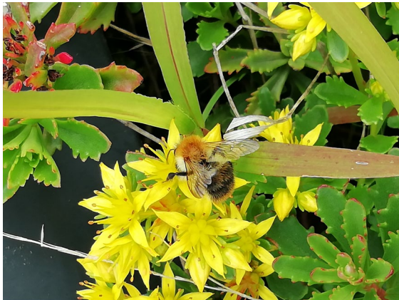
Abb. 7: Die Ackerhummel ( Bombus pascuorum Scop.) saugte vornehmlich auf blühender Glanzfetthenne ( Phedimus subgen. aizoon ).

Die Blauflügelige Ödlandschrecke wird in der Gefährdungskategorie 2 (stark gefährdet) nach Roter Liste Mecklenburg-Vorpommerns (WRANIK et al. 1996) geführt. Auch bei den Hummeln konnten vier Arten auf der in Richtung Herrensee gelegenen mittleren Ebene beobachtet werden. Dabei handelte es sich um die Dunkle Erdhummel ( Bombus terrestris L.), die Helle Erdhummel ( Bombus lucorum L.-Komplex), die Ackerhummel ( Bombus pascuorum Scop., Abb. 7) und die Steinhummel ( Bombus lapidarius L.). All diese Arten sind nicht selten, stehen aber als „besonders geschützt“ unter Artenschutz. Die Tiere saugten zumeist an blühenden Fetthenne-Pflanzen.