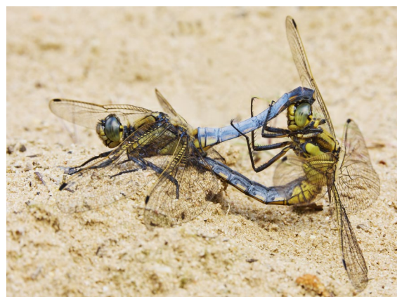
Abb. 8: Großer Blaupfeil ( Orthetrum cancellatum ), Paarungsrund am Kraaker Waldsee am 11. November 2014.

Der 1986 veröffentlichte Film Ein Wigwam für die Störche orientiert sich frei an einer seiner Erzählungen. Basierend auf seinem Buch Wasseramsel entstand 1990 der DEFA-Spielfilm Biologie! (Arbeitstitel: Die Wasseramsel ) unter der Regie von Jörg Foth und mit Stefanie Stappenbeck in der Hauptrolle.