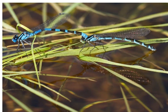
Abb. 6: Eiablage eines Azurjungferpaares in Sibirien.