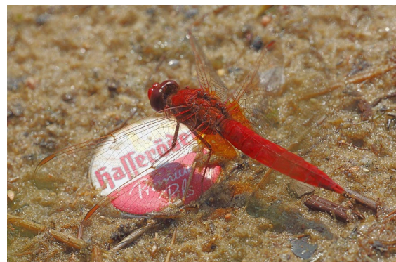
Abb. 2. Feuerlibelle ( Crocothemis erythraea ) Männchen am 9.7.2014, Kraaker Waldsee. Der Kommentar von Wolf Spillner dazu: „Ach, die lieben Angler!“

Zuge der Klimaerwärmung vorkommt (ZESSIN 2007).