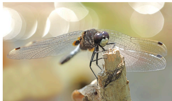
Abb. 7: Zierliche Moosjungfer ( Leucorrhinia caudalis), Männchen, am 22.6.2012, Kraaker Waldsee.